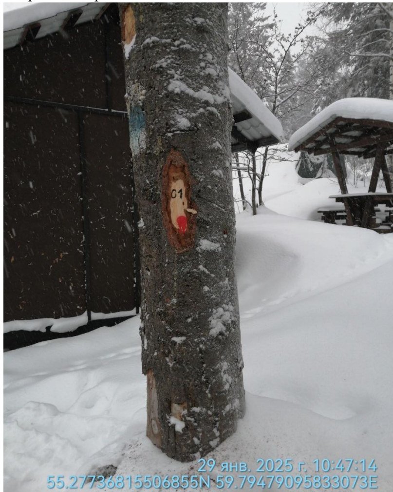
Аварийное дерево № 1