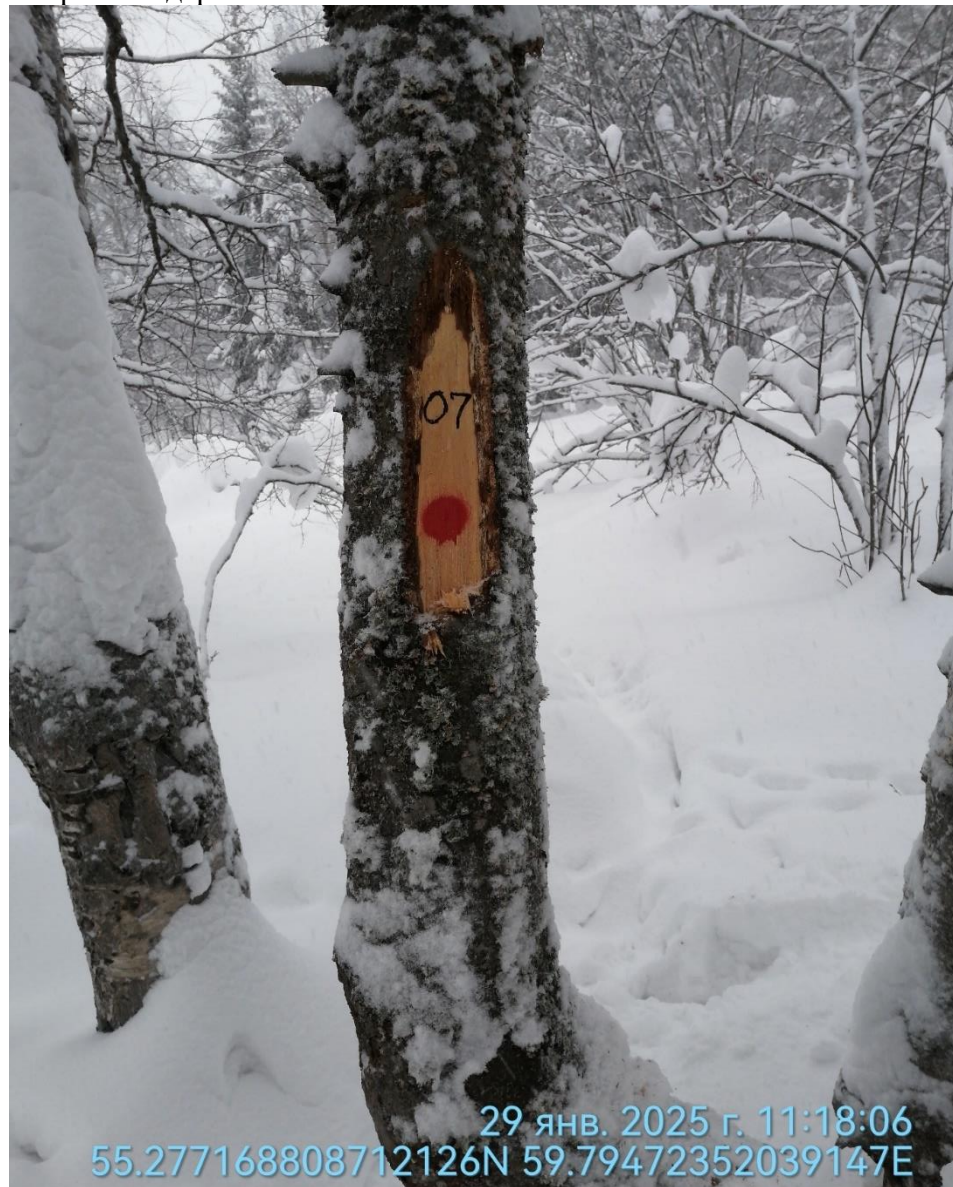
Аварийное дерево № 7