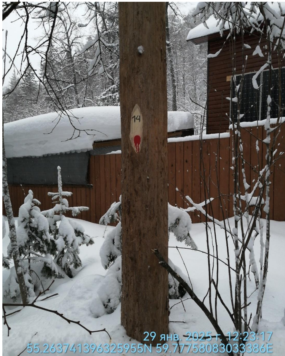
Аварийное дерево № 14